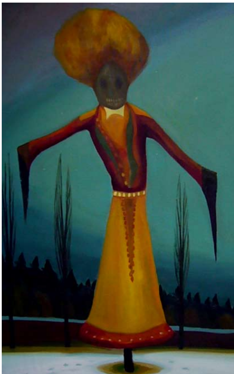
Smrtka / The Pulpit of Death

2006, 142x91 cm, olej na plátně / oil on canvas