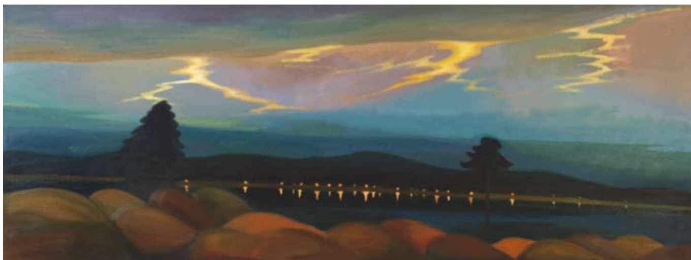
Jezero v bouři / The Lake in a Storm 2006, 86x179 cm, olej na plátně / oil on canvas