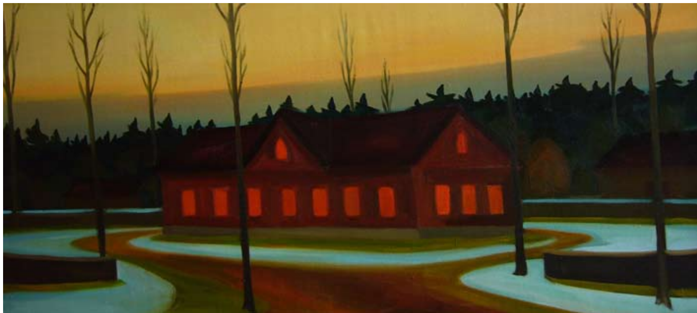
Fara / The Rectory 2006, 75x162 cm, olej na plátně / oil on canvas