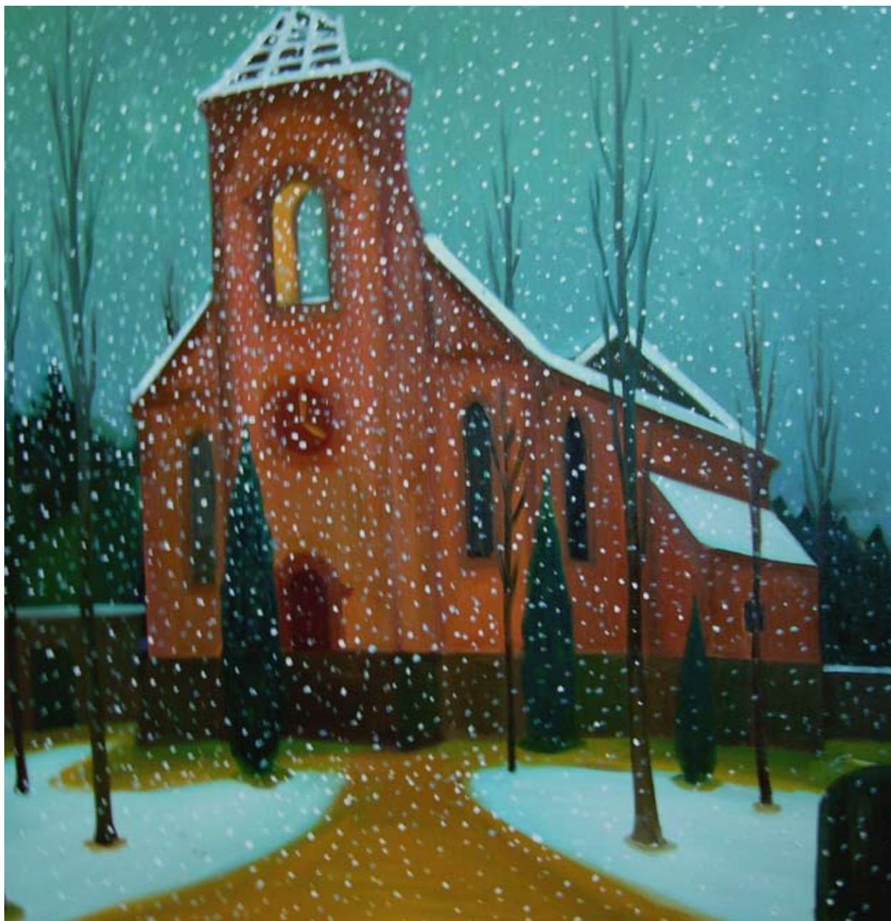
Vypálený kostel / The Burned-out Church 2007, 111x111cm, olej na plátně / oil on canvas