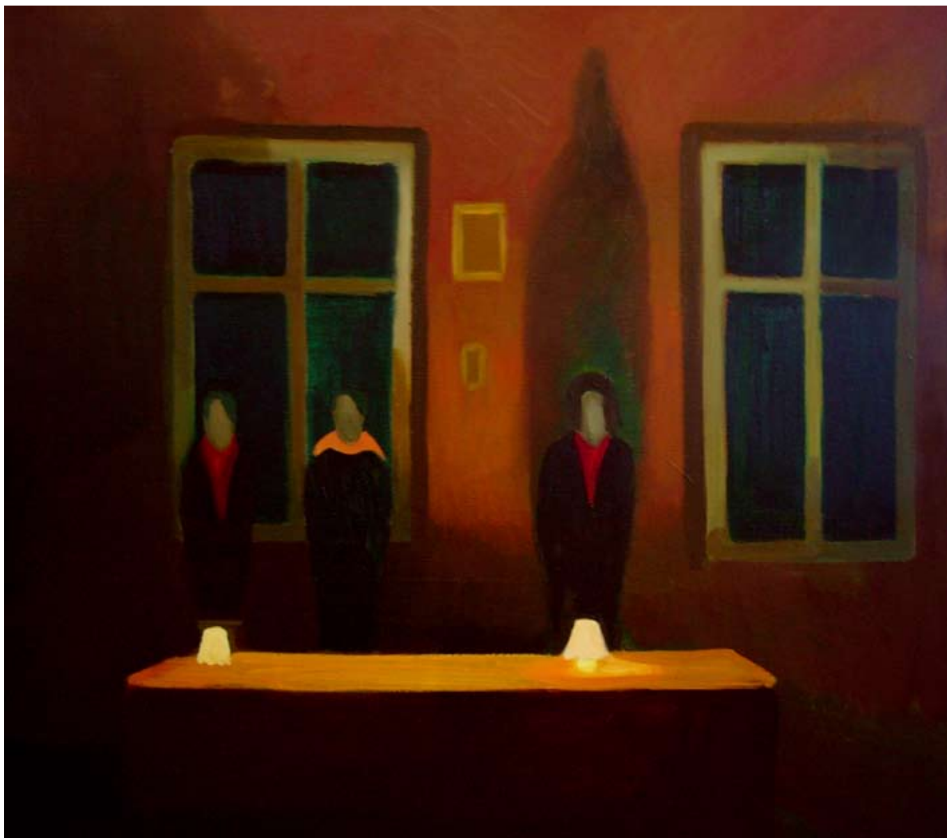
Hospoda / The Pub 2005, 94x104 cm, olej na plátně / oil on canvas