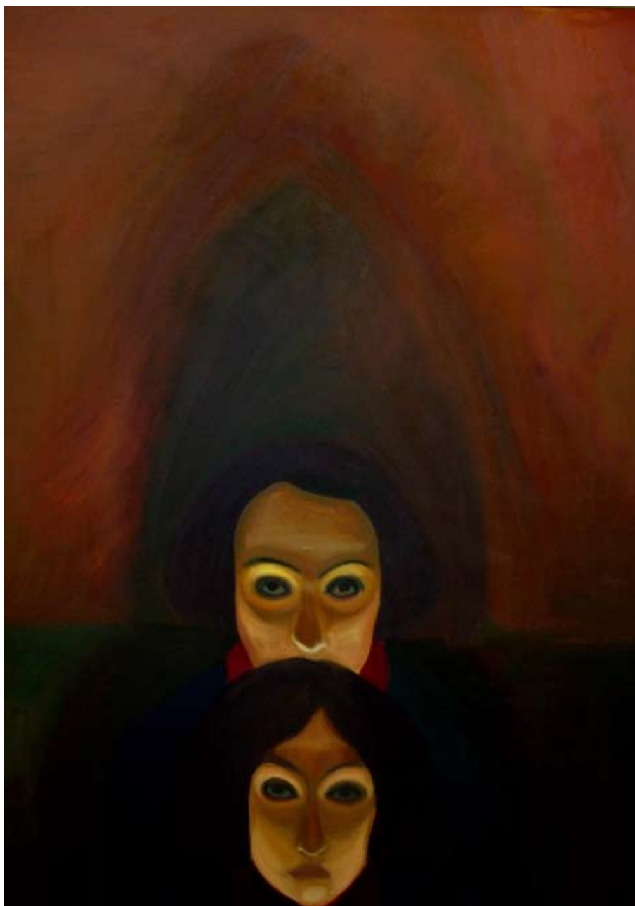
Přítelkyně / Girlfriends 120x89cm, olej na plátně / oil on canvas