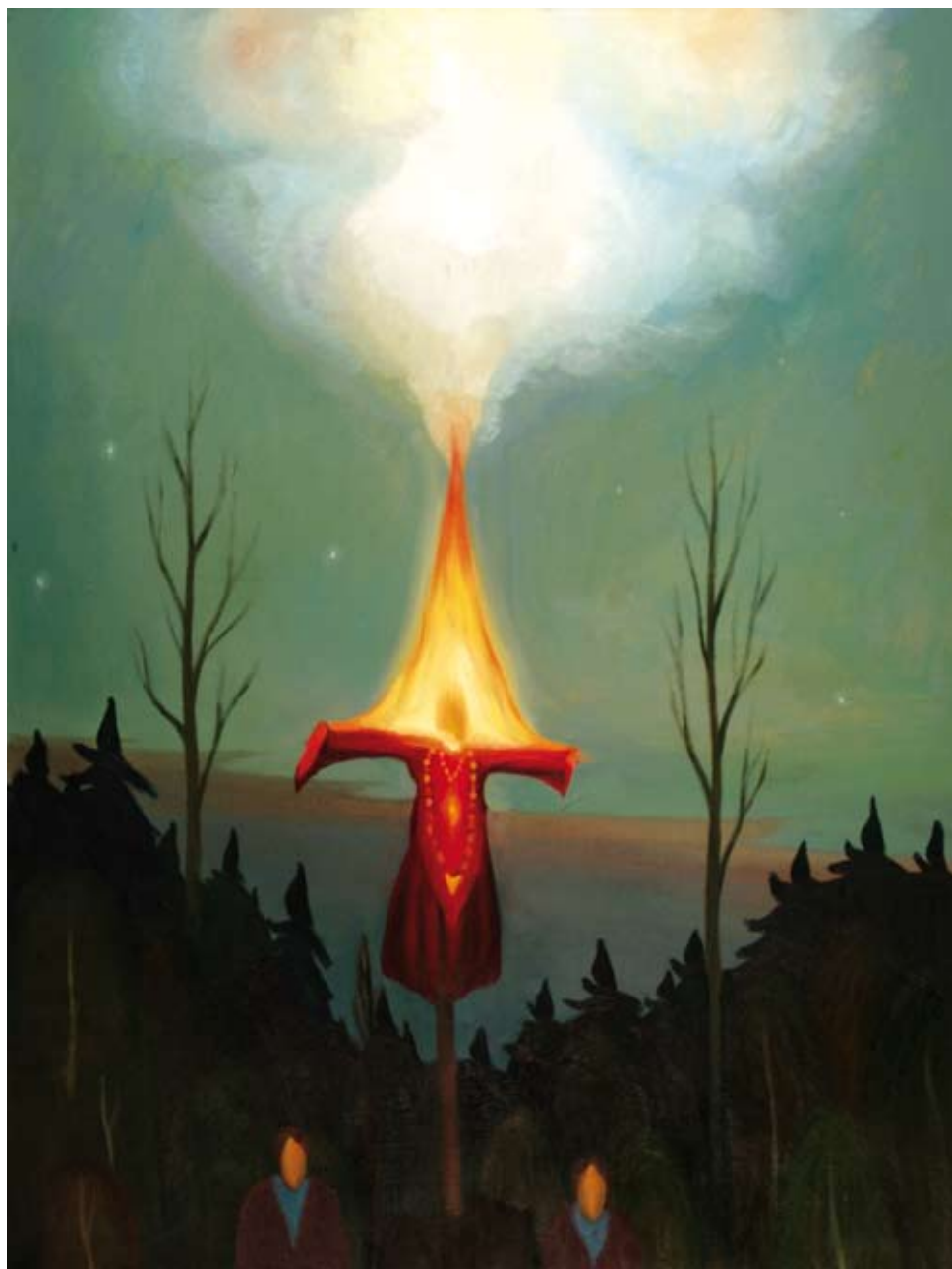
Hořící čarodějnice / The Burning Witch 2006, 137x103olej na plátně / oil on canvas