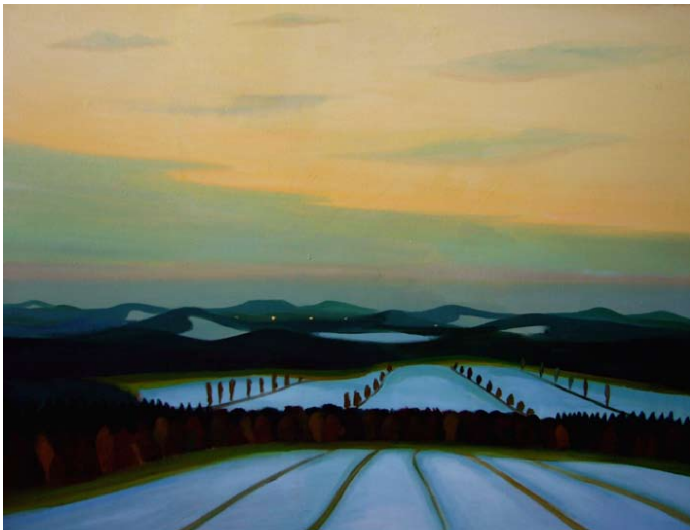
Středohoří / The Středohoří Mountains 2005, 116x151cm, olej na plátně / oil on canvas