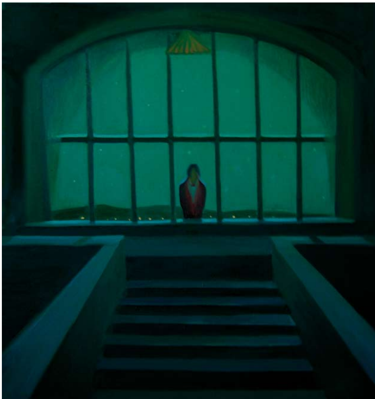
Číšník / The Waiter

2007, 123x118 cm, olej na plátně / oil on canvas