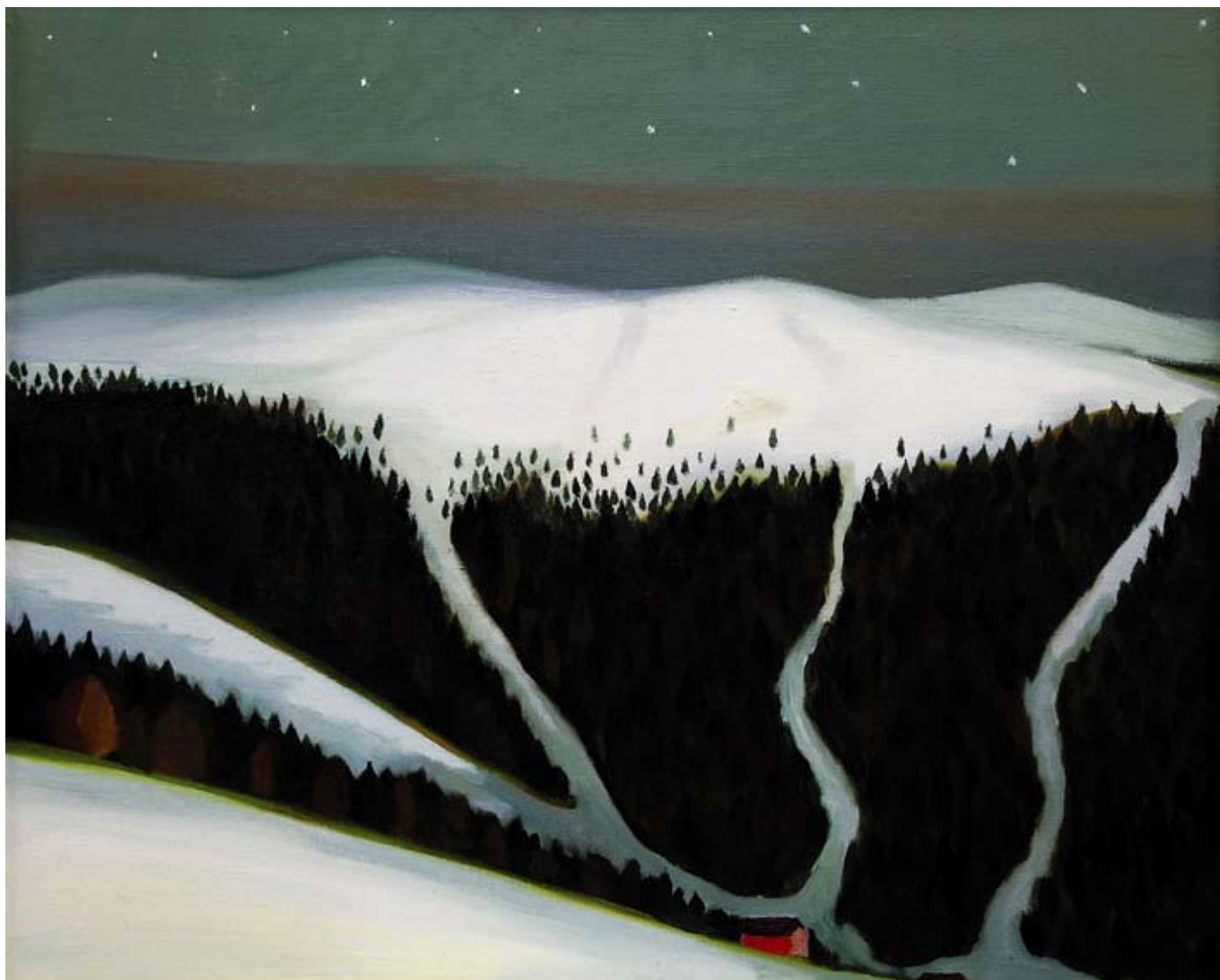
Horská noc / A Night in the Mountains 2006, 80x100 cm, olej na plátně / oil on canvas