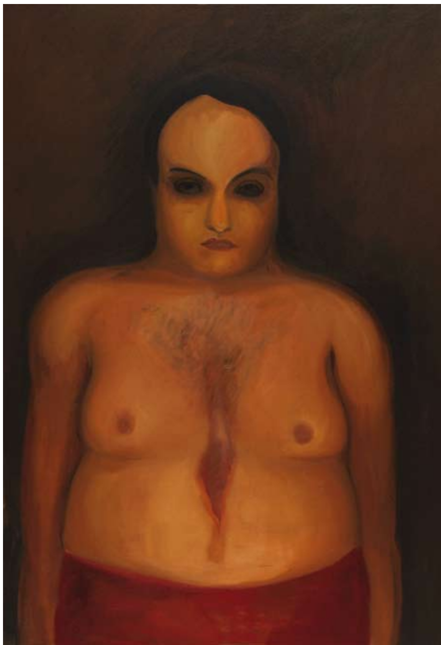
Vesničan / A Countryman

2006, 118x85 cm, olej na plátně / oil on canvas