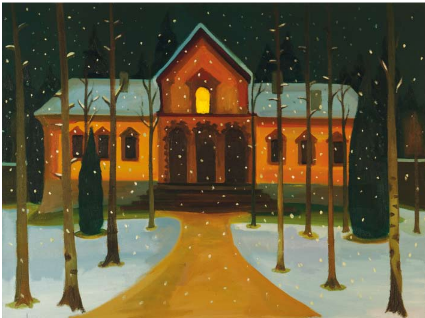
Dětská nemocnice / Children's hospital 2004, 88x118 cm, olej na plátně / oil on canvas