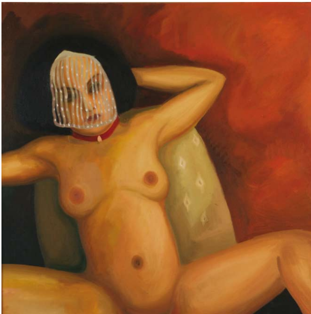
Děvka / The Bitch

2006, 102x104 cm, olej na plátně / oil on canvas