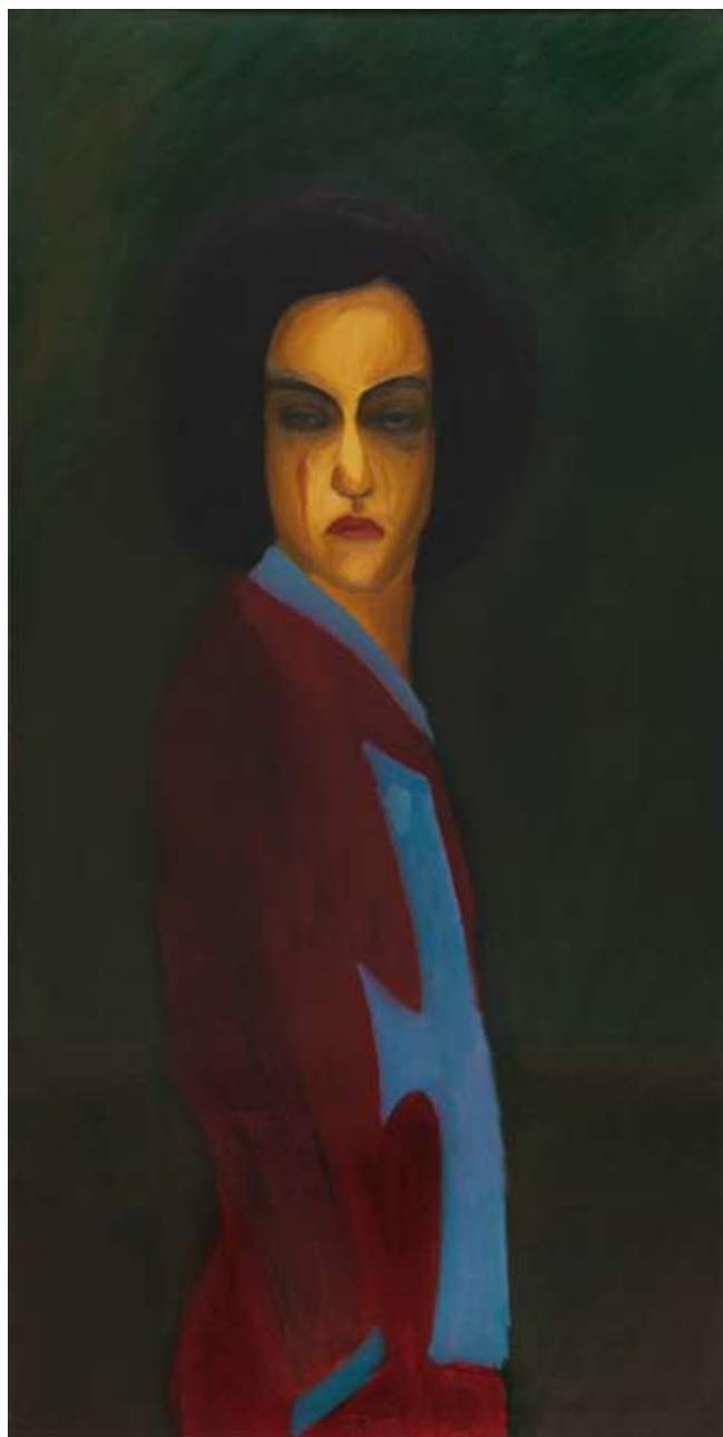
Homosexuál / The Homosexual 2005, 149x75 cm, olej na plátně / oil on canvas